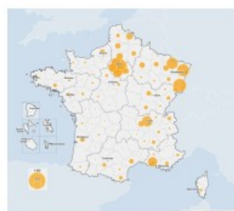
Figure 1. Nombre de cas de COVID-19 hospitalisés en France, au 24/03/2020, 14h00